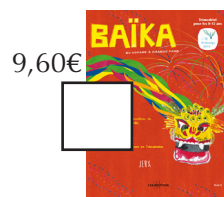
POLOGNE / CHINE