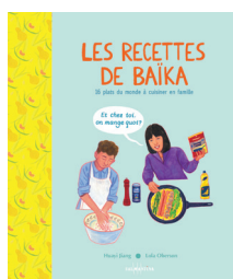
LES RECETTES DE BAÏKA