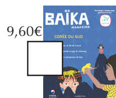
CORÉE DU SUD