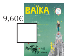
CANADA / GUATEMALA